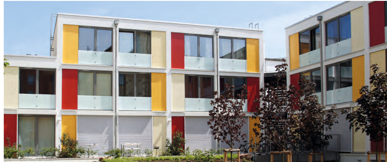
Stylisch und komfortabel: Die Apartments in der Wohnanlage B 7.