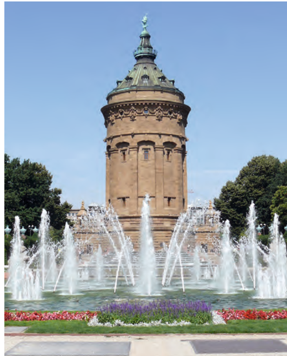
Berühmtes Wahrzeichen: Der Friedrichsplatz rund um den Mannheimer Wasserturm ist beliebter Treffpunkt in der Innenstadt.

Mannheim (kurpfälzisch: Mannem [ manem ]) ist das lebendige Zentrum der Metropolregion Rhein-Neckar, eine der wirtschaftsstärksten Regionen in Europa. Gleichzeitig gilt die über 400 Jahre alte Quadrate- und Universitätsstadt als Deutschlands Hauptstadt des Pop mit einem riesigen Kulturangebot, als großstädtische Einkaufsmetropole sowie als Standort exzellenter Hochschulen. Studierende finden im multikulturell geprägten Mannheim den idealen Nährboden für die Entwicklung von Persönlichkeit und beruflichem Know how.