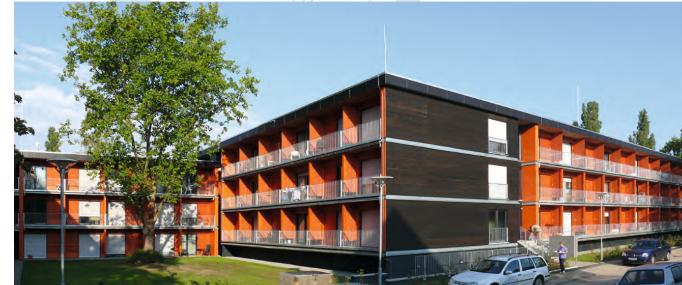
Die Wohnanlage „Eastsite“ liegt in unmittelbarer Nachbarschaft zu den Universitäts-Sportstätten am Luisenpark im attraktiven, grünen Stadtteil Neuostheim.