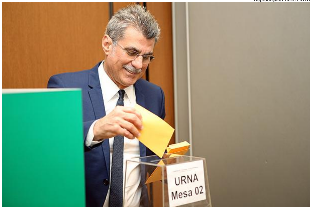
Presidente do PMDB, senador Jucá não deve ter dificuldade para se reeleger, segundo professor